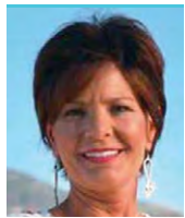
Yvette Herrell (R)

disfuncional. El caos y el desorden resultantes, incluida la destitución sin precedentes de un presidente, han obstaculizado el progreso y han dejado a muchos estadounidenses desatendidos. Nuevo México merece algo mejor. Me concentro en servir a la gente abordando los desafíos cotidianos que enfrentan las familias trabajadoras. Desde la asequibilidad de los alimentos hasta la disponibilidad de vivienda, mi compromiso es generar mejoras tangibles que impacten positivamente a nuestros electores. Para restablecer la funcionalidad del Congreso, debemos recuperar la mayoría y elegir líderes que prioricen los resultados sobre el caos. Es hora de pasar de las políticas que dividen y exacerban a las que crean un futuro más brillante y equitativo para todos los estadounidenses.