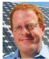
Jeff Steinborn - District 36 (D)

1. State Senator - 2016 to Present / State Representative - 2006 to 2010 / 2012 - 2016