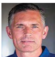
Martin Heinrich (D)

1. As your Senator, we've passed legislation to deliver unprecedented investments for our children, our working families, and our seniors in New Mexico. Because of these investments, we've begun to see costs for things like groceries and