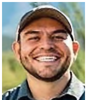
Gabriel Vasquez (D)

1. Los republicanos extremistas priorizan las políticas sobre las soluciones. El problema mayor que tenemos en el Congreso es como gobernamos de verdad porque eso afecta los derechos reproductivos de las mujeres, la inflación, la vivienda asequible, la inmigración y la seguridad fronteriza, que son de máxima importancia que el Congreso debe resolver. A mis electores les preocupa la economía, el acceso al agua potable, la banda ancha asequible y la atención médica de calidad, incluida la atención médica reproductiva de las mujeres. A diferencia de mi oponente, que patrocinó una