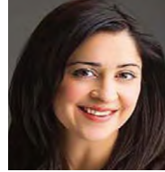
Briana H. Zamora (Nonpartisan)

1. As a judge, I have served at all levels of the judiciary from the Metropolitan Court to the Supreme Court. I have presided in thousands of cases and well over a hundred jury trials. New Mexicans deserve experienced judges who are independent and have integrity. I have a wealth of judicial experience and a reputation of integrity and fairness. I hope to continue my service to New Mexico as a Supreme Court Justice.